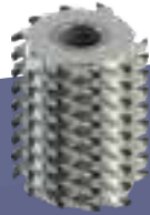
MULTICUT SPIRAL CUTTERS FRESE ELICOIDALI MULTITAGLIENTI