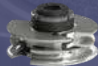
DOORS AND WINDOWS TOOLS GRUPPI PER PORTE E FINESTRE