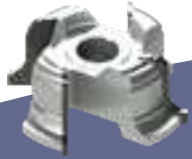
BRAZED CUTTERS FRESE SALDOBRSATE