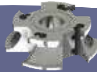
INSERT CUTTERS TESTE PORTACOLTELLI